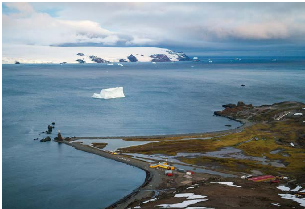
Na pierwszym planie stacja imienia Henryka Arctowskiego, w tle dryfująca góra lodowa

pokładzie oprócz niego i Polaków na początku wyprawy było jeszcze dwunastu Belgów, sześciu Norwegów, Rumun i Francuz. Łącznie dwadzieścia trzy osoby. Jak pisze w swoich pamiętnikach 21 Roald Amundsen, uczestnik tej wyprawy, śmiałkom towarzyszył kot Nansen. Badacze mieli z nim niemałe utrapienie, bo wyjadał ryby, które chciano przywieźć do Europy jako okazy nieznanymi do tej pory gatunków. Na próżno szukać w diariuszu opisów heroicznym wyczynom i niestworzonym przygód. Wiele zapisków otwiera aktualna prognoza pogody, a z kart wyziera nuda i monotonia. Wbrew powszechnym wyobrażeniom takie właśnie są realia wielu wypraw, z czego ci, którzy są spragnieni opowieści o bohaterskich czynach, nie zdają sobie z tego sprawy. Co się stało z kotem, autor nie pisze, ale wyprawa, mimo