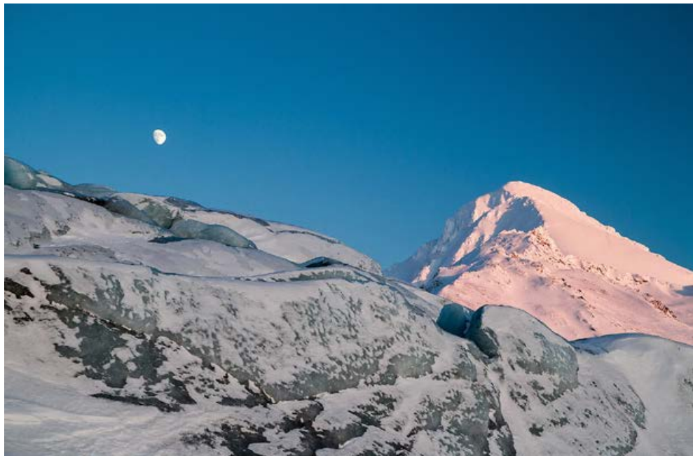
Martwe czoło Wschodniego Lodowca Torella

warstwą czynną. Ta ostatnia może mieć grubość od kilkudziesięciu centymetrów do ponad dwóch metrów. Głębiej jest warstwa zamrożonego gruntu, sięgająca nawet kilometr w głąb, która nie rozmarza przez setki, tysiące lat.