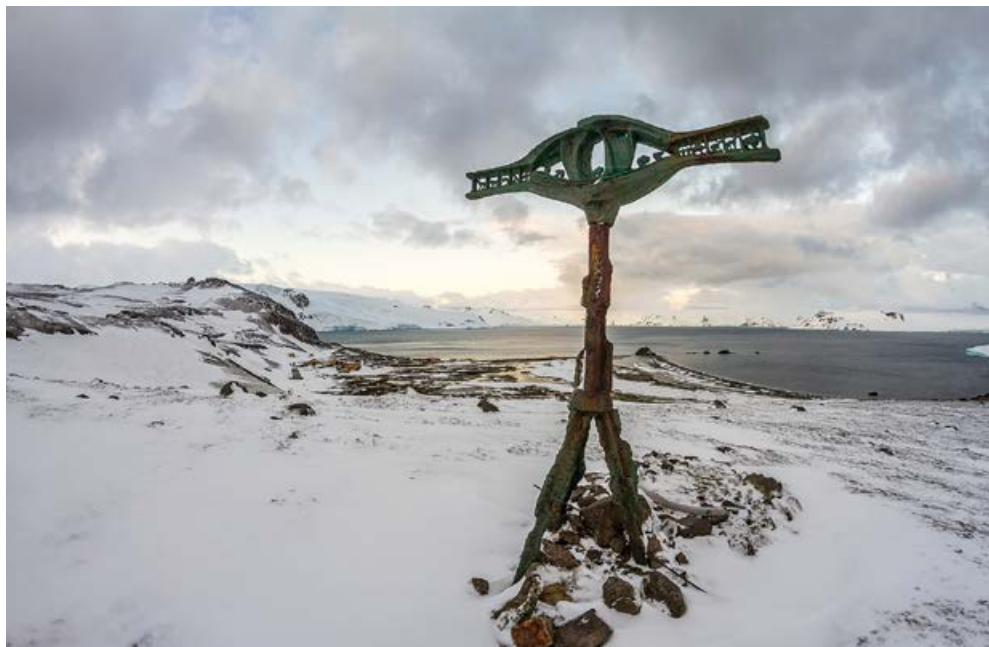
Miejsce wiecznego spoczynku Włodzimierza Puchalskiego