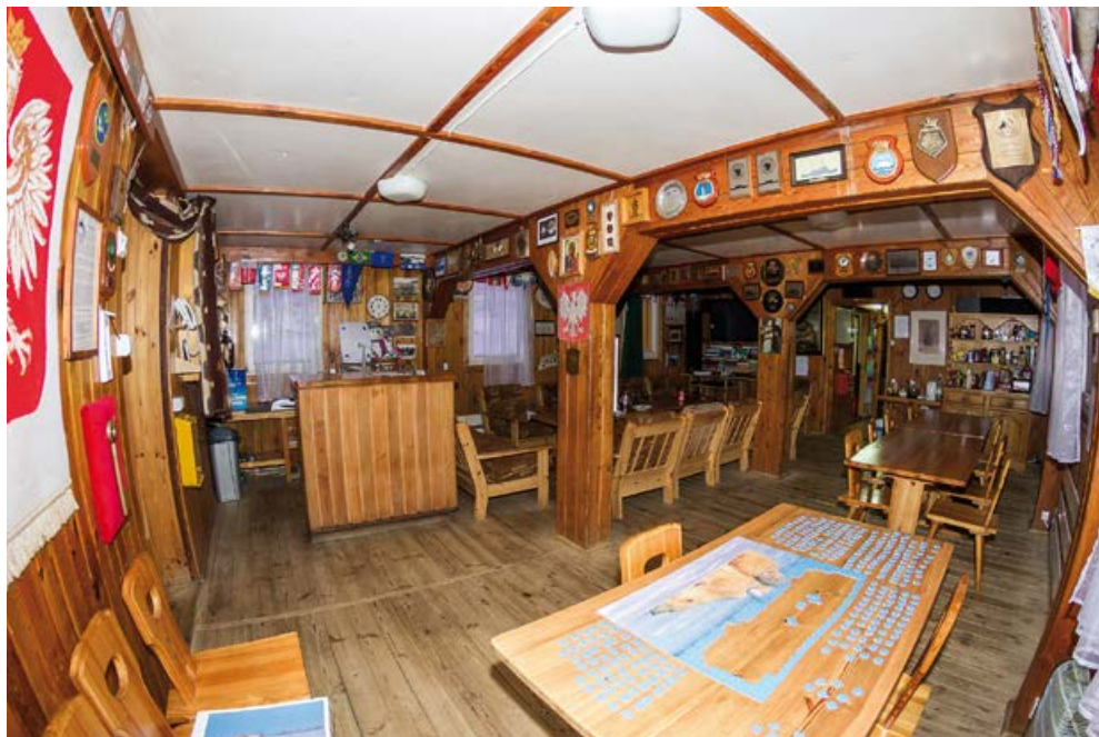
Wnętrze polskiej stacji na Wyspie Króla Jerzego: mesa...

I choć w końcu nauczyłam się planować z kilkudniowym wyprzedzeniem wszelkie rozmowy z rodziną i przyjaciółmi, a terminy zapisywać na żółtych karteczkach samoprzylepnych, przez całe zimowanie na moim komputerze niezmiennie obowiązywał czas polski.