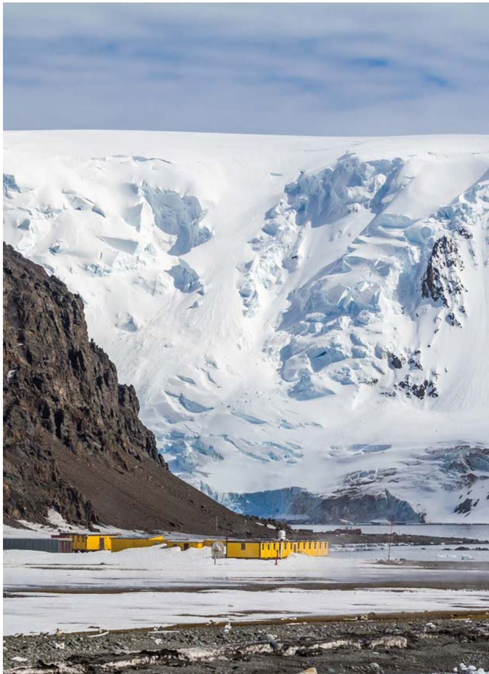
■ Polska Stacja Antarktyczna imienia Henryka Arctowskiego